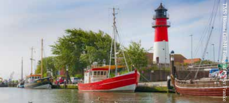
TMS Bütsum GmbH / Fotograf: Oliver Franke